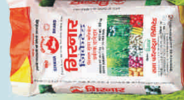
जिकेटेड सिंगल सुपर फॉस्फेट