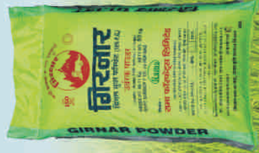
सिंगल सुपर फॉस्फेट