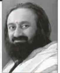
- श्रीश्री रविशंकर

और वह बच्चा किस प्रकार अपनी मां की प्रतीक्षा करता है। पक्षी आता है और अपने बच्चों को खिलाता है। इस में प्रेम है। इसी तरह मछली में प्रेम है।