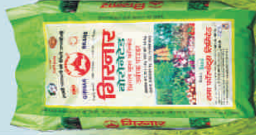
बोरानेटेड सिंगल सुपर फॉस्फेट