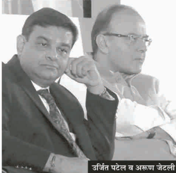
उर्जित पटेल व अरूण जेटली

अर्थतंत्र के लिहाज से देखें तो सरकार और रिजर्व बैंक एक ही गाड़ी के दो पहिए हैं। इनके समन्वय से ही गाड़ी आगे बढ़ती है। यह भी सही है कि दोनों के बीच मौद्रिक संतुलन को लेकर मतभेद चलते रहते हैं पर ये मतभेद इस प्रकार खुलकर सामने नहीं आते जैसा इस बार हुआ। सरकार चाहती है कि रिजर्व बैंक अपनी नीतियों में थोड़ी नरमी लाए ताकि वह अपने राजनीतिक लक्ष्यों को साधते हुए आम जनता को कुछ राहत दे सके। यह सच है कि कुछ दशकों से हमारे बैंकिंग सेक्टर में अराजकता की स्थिति आई थी। आरबीआई ने भी लंबे समय तक सरकारी बैंकों के फंसे हुए कर्ज को लेकर अपना मुंह फेरा और अब अचानक से सारे मानक सख्त कर दिए जो अंतरराष्ट्रीय मानकों से भी कड़े हैं। निश्चित रूप से ऐसा करने के पीछे आरबीआई की मंशा में बढ़ते एनपीए को रोकने और इसे वापस मार्केट में जाने की होगी। यही बात शायद दोनों के लिए गतिरोध बन रही थी। फिलहाल अच्छी बात यह है कि सरकार और केंद्रीय बैंक की पूंजी डूबने को लेकर जो जानकारियां सामने आई हैं वे तभी आई जब रिजर्व बैंक के नियम बदले। कंपनियों को दिवालिया घोषित करने का कानून इसीलिए बनाना पड़ा ताकि डूबी हुई पूंजी को वसूला जा सके। इस लिहाज से दोनों के बीच हुई बैठक एक महत्वपूर्ण पड़ाव साबित होगी।